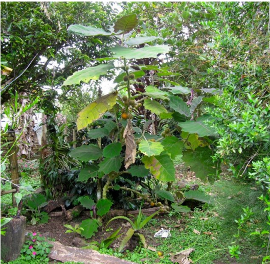
Planta de lulo