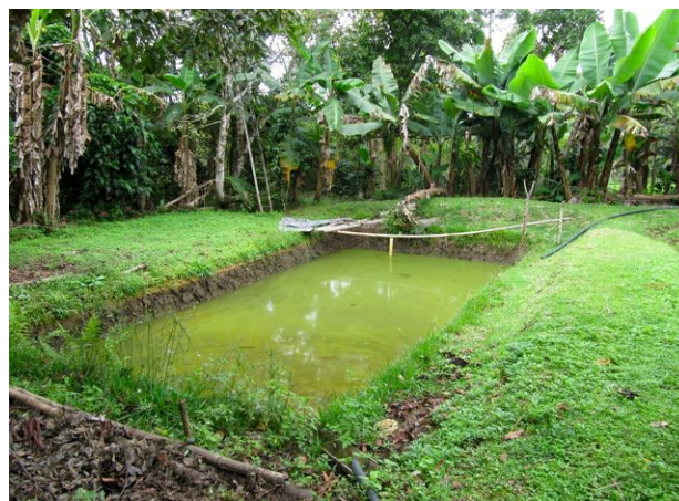
Estanque para peces