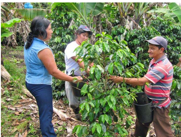
Coseja de café