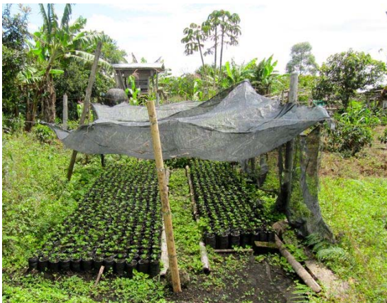
Plantas de café para sembrar