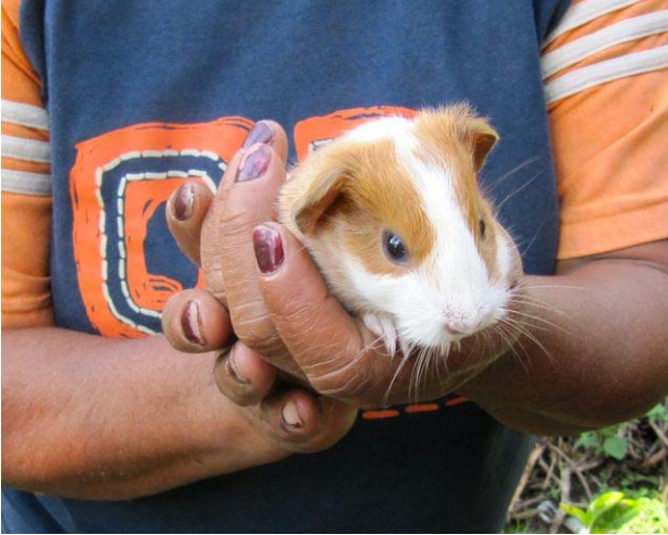
Cuy para abono organico y alimentacion