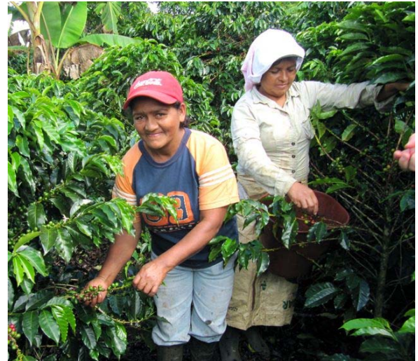
Recolección de café con familiares