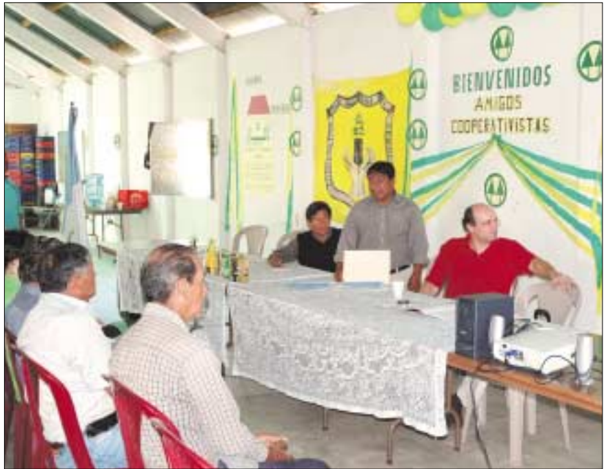
Versammlung. Regelmässig treffen sich die Mitglieder der Kooperative. Dort bestimmen sie, in welche neuen Dorfprojekte die Prämiegelder fliessen sollen.