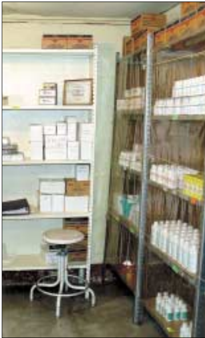
Gesundheit. San Pedrano hat mit den Geldern eine Apotheke eingerichtet.