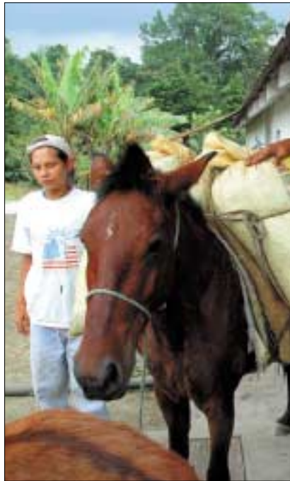
Transport. Auf Pferden wird die Ernte ins Zentrallager von Fedecocagua gebracht.